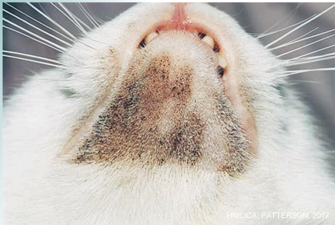
HNILICA; PATTERSON, 2017