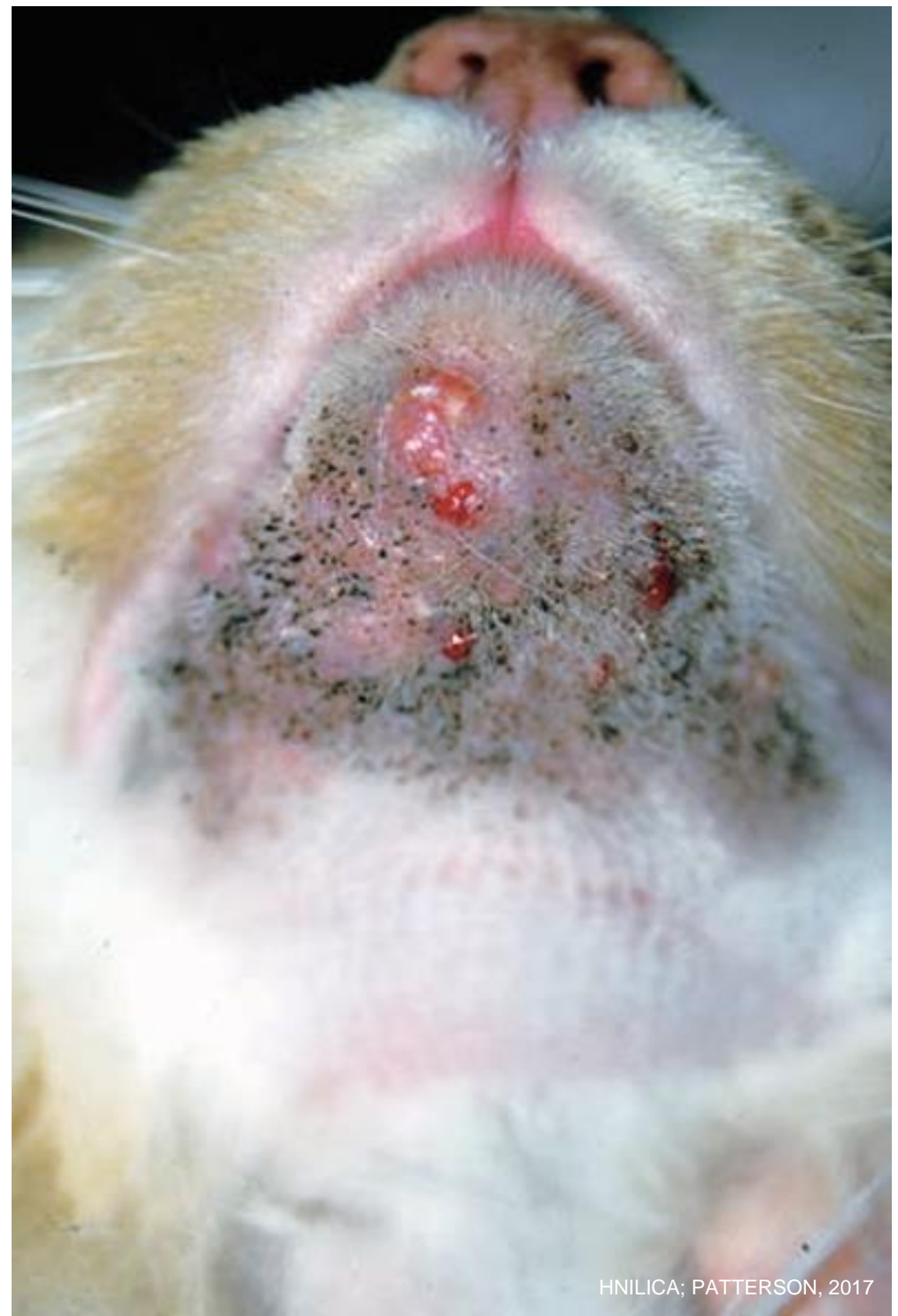
HNILICA; PATTERSON, 2017