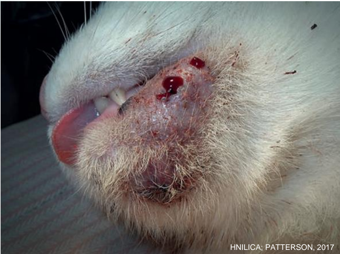
HNILICA; PATTERSON, 2017